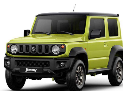
Bitono Verde Kinético - Negro