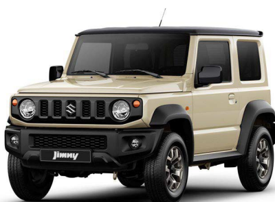
Bitono Marfil - Negro

Nota: El fabricante y el importador se reservan el derecho a modificar las especificaciones sin previo aviso. Los detalles sobre especificaciones, equipamiento, disponibilidad de colores y línea de accesorios, dependen también de los requisitos y disposiciones locales.