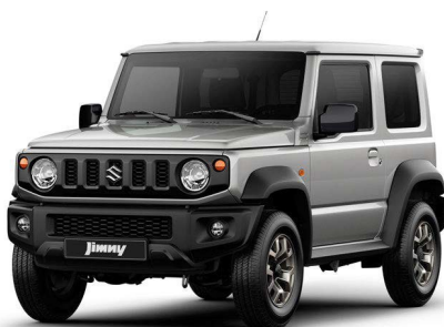
Monotono Gris Perlado