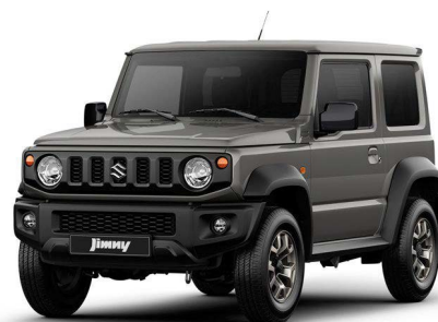
Monotono Gris Plomo