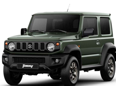
Monotono Verde Jungla