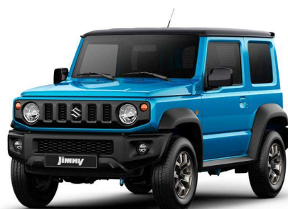
Bitono Azul Energético - Negro