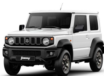
Monotono Blanco Polar