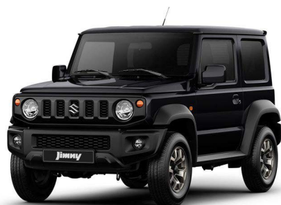
Monotono Negro Midnight